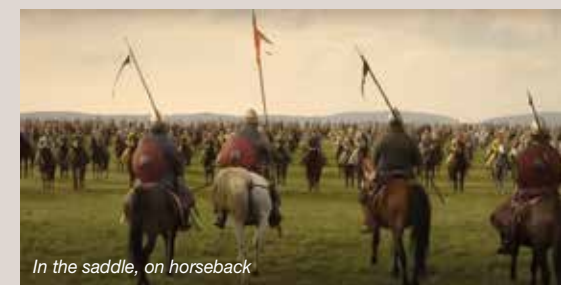
In the saddle, on horseback

Il film riporta lo spettatore al X secolo, illustrando l'arte della guerra durante la conquista ungherese del bacino dei Carpazi. Il viaggio inizia con la realizzazione delle armi stesse, guida il pubblico attraverso le loro modalità di utilizzo e si conclude con l'analisi delle campagne successive alla conquista. Interessante indagine sulle tecniche di guerra in quell'epoca.