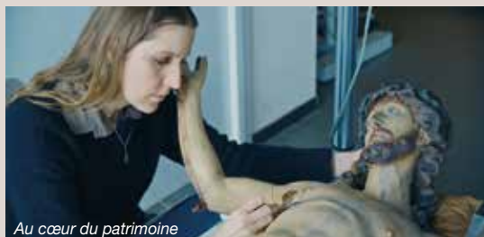
Au cœur du patrimoine

In Belgio nel cuore del Royal Institute for Cultural Heritage (RICH), un team di appassionati lavora per preservare il patrimonio belga. Grazie alla conservazione e al restauro di dipinti, sculture danneggiate, oggetti fragili ed edifici religiosi devastati dalle recenti inondazioni, torna in luce un passato raro e prezioso.