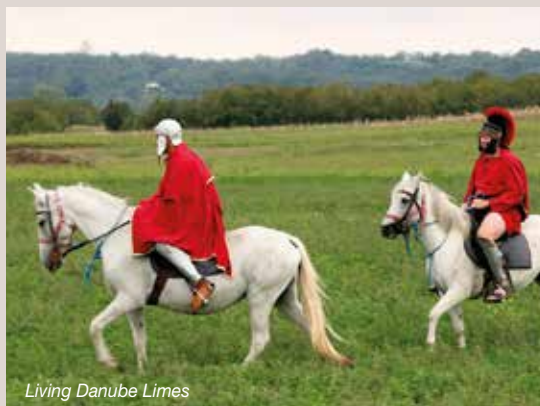
Living Danube Limes

Com'era navigare sul Danubio nell'antichità, quando il fiume rappresentava il confine del potente Impero romano, il famoso Limes? Sappiamo che i confini dell'impero erano presidiati dall'esercito romano che lo difendeva dalle selvagge tribù barbare che si trovavano dall'altra parte del Danubio. Ma che tipo di navi usavano i romani e che tipo di vita si svolgeva ai confini del potente impero? Cosa rappresentano le tavolette rinvenute sul Danubio, di cui quella di Traiano è la più famosa? E perché proprio il ponte di Traiano era considerata una delle meraviglie del mondo del suo tempo?